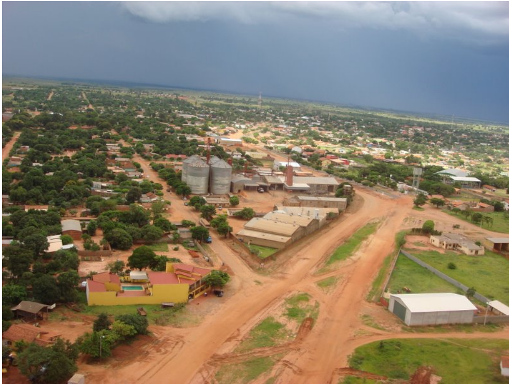
Vista aérea de Capitán Bado